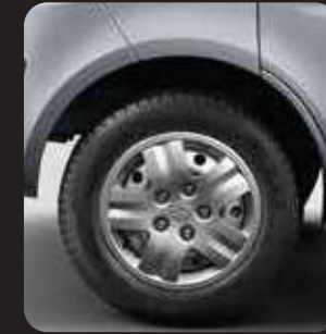
5 LUG NUT 175/70R14 TIRE