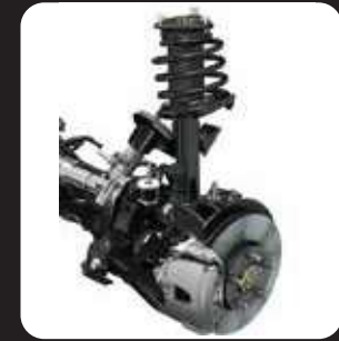
FRONT MACPHERSON SUSPENSION DISC BRAKES (WITH VACUUM BOOSTER)