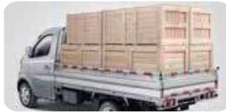
ایک ٹن وزن کی گنجائش۔

شریادہ ماہر کوہ پیما ہیں جو اپنی انتھک محنت، جفاکشی، انتہائی بہادری اور قوت کے ساتھ پہاڑوں کی چوٹیاں سر کرنے والے ٹیم جوڈ کی مدد کرتے ہیں۔ چنگان آٹو ان تمام شریا اور کوہ پیماؤں کو خراج تحسین پیش کرتا ہے۔ جو کبھی ہار نہیں مانتے! اسی لیے چنگان آٹو لایا پاکستان میں تیار کردہ (M9 SHERPA) پک اپ، جس میں پاکستان کا سب سے طاقتور C10 1000cc انجن یورو 4 ٹیکنالوجی کے ساتھ، 16 والو اور DOHC جو 68HP اور 92NM ٹارک پیدا کرتا ہے۔ 5 اسپید گیئر ڈبل ٹاپ دے چھوٹے اور لمبے روٹ کے لیے بہترین ایندھن کی بچت، یہ با آسانی 1 ٹن وزن اٹھائے اور اس کا تین طرف سے کھلنے والا 9x5 فٹ کا ڈاڈے زیادہ لوڈنگ کی گنجائش اور زیادہ نفع، خوبصورت انٹیریئر، آسان اسٹیرنگ آپریشن اور ویکٹیو بریک بوسٹر دے آپ کو پر اعتمادی آمدہ اور آسان ڈرائیونگ، (M9 SHERPA) دے آپ کو 3 سال 60,000 کلومیٹر وارنٹی اور ملک بھر میں پھیلا وسیع 3S ڈیلرز نیٹ ورک۔