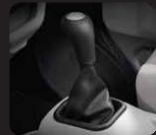
5 SPEED MANUAL TRANSMISSION