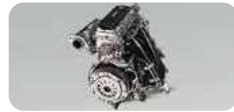
طاقتور C10 1000cc انجن