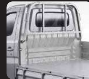
INTEGRATED CABIN AND DECK FOR BETTER STABILITY