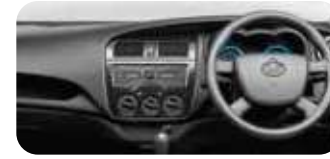
آرام دے انٹیریئر کیبن